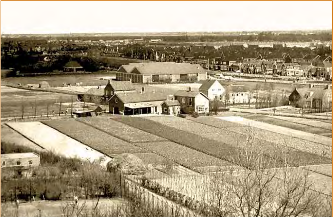
Een beeld van de Zanderij in de jaren zestig. Op de voorgrond de eerste tennisbanen, thans deel van de begraafplaats, de Kramersweg en nog iets verder het veilinggebouw, waar ooit het Slingerpad en het Radiopad liepen.