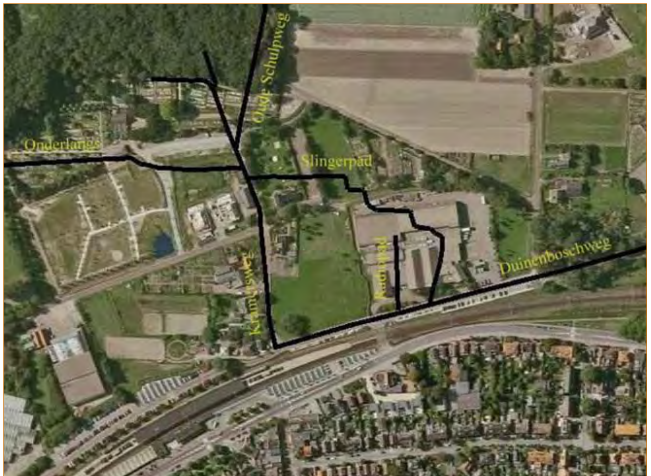
Op deze luchtfoto uit 2009 zijn onder andere het Slingepad, Radiopad en Onderlangseweg aangegeven naar de situatie rond 1937.