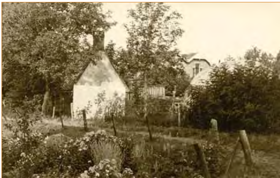
Een romantisch beeld van het Slingerpap.