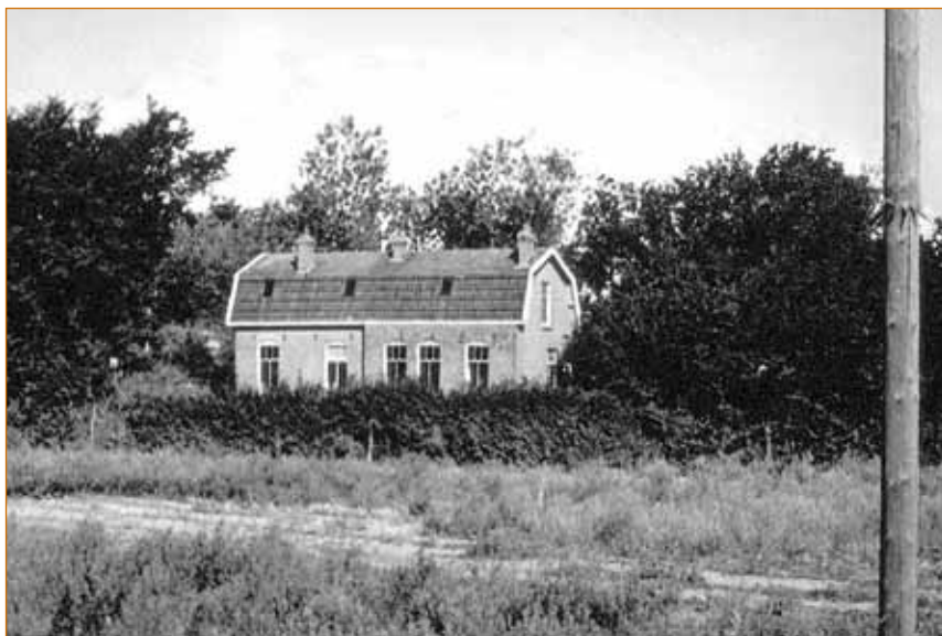
De ziekenbarak die aan het einde van de Kramersweg stond, bij de aftakking van de Oude Schulpweg, werd in 1914 gebouwd.