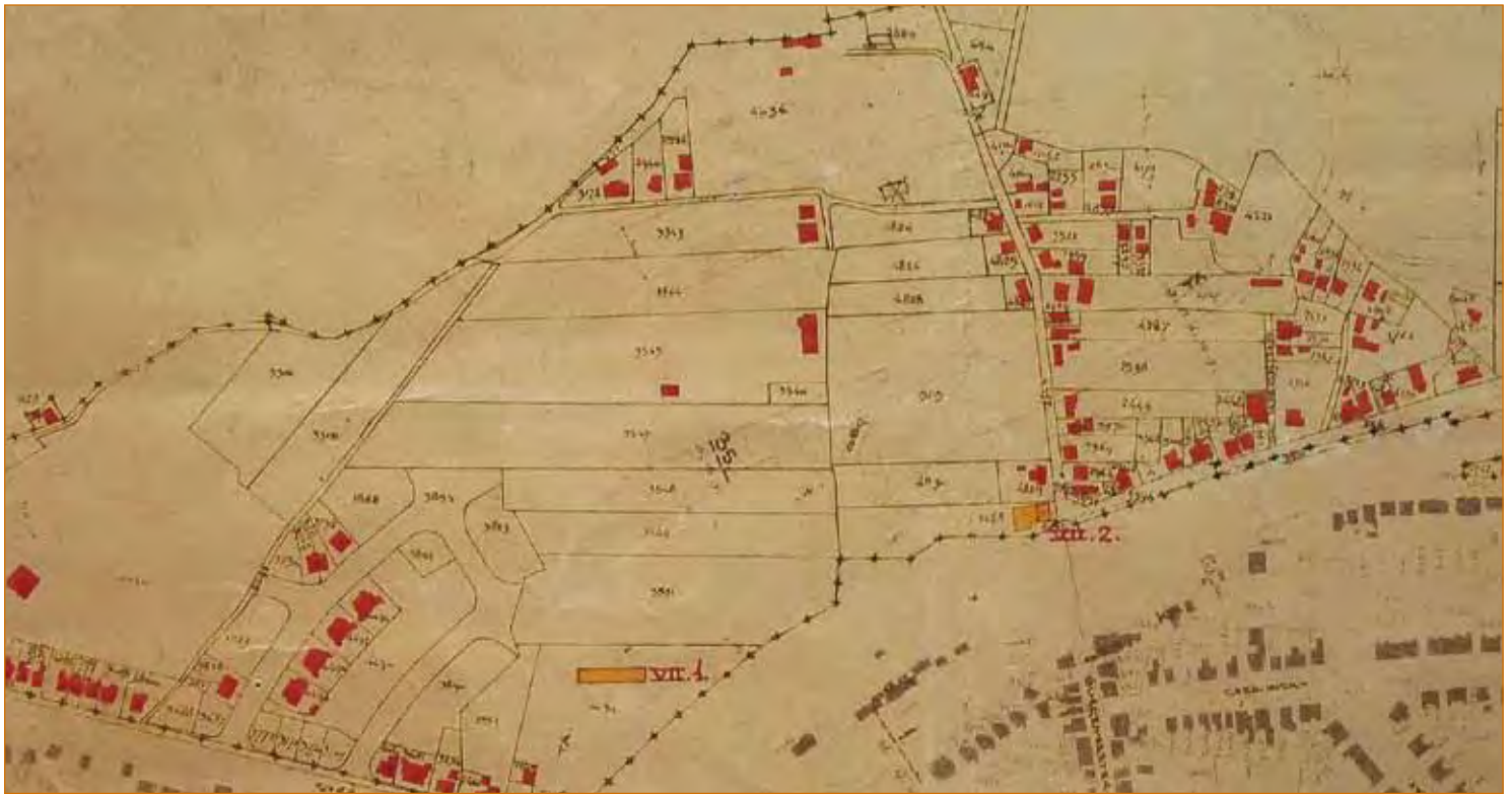
Een gedeelte van de zogenaamde 'verwoestingskaart', behorende bij het wederopbouwplan, waarop de vele afgebroken woningen aan de westkant van het dorp met een rode kleur zijn aangeduid.