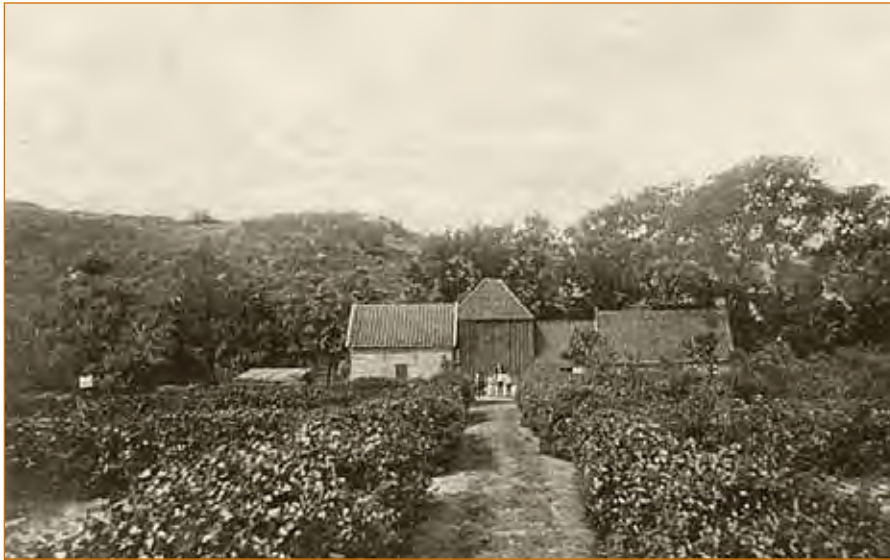
Boerderij 'de Papenberg' aan de rand van het duingebied, waar tot 1925 de familie Stuijbergen boerde. Daarna werd de boerderij overgenomen door Dorus Ineke.

Een kijkje vanaf het pad naar de ziekenbarak de Kramersweg in. Links is een reclamebord te zien van Piet Bakker, de gistboer en in het eerste huis rechts vinden we het winkeltje van Jaap Stuijbergen. Naast dat huis liep het Onderlangs en er tegenover kwam het Slingerpad op de Kramersweg uit.