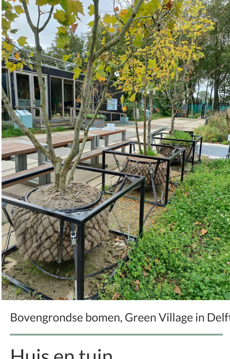
Bovengrondse bomen, Green Village in Delft

Begin 2023 is het beleid- en uitvoeringsprogramma 2023-2026: 'Op weg naar klimaatadaptieve en natuurinclusieve gemeenten' vastgesteld. Daarin zijn klimaatbestendige eisen vastgesteld voor wateroverlast, droogte, hitte, kans op overstromingen en biodiversiteit. De regionaal opgestelde eisen zijn inmiddels ook door het Rijk overgenomen in de landelijke maatlat voor een groene klimaatadaptatie omgeving. Het uitvoeringsprogramma omvat activiteiten op drie schaalniveaus: 'Huis en pand', 'Straat, wijk en gebied' en 'Regio'.