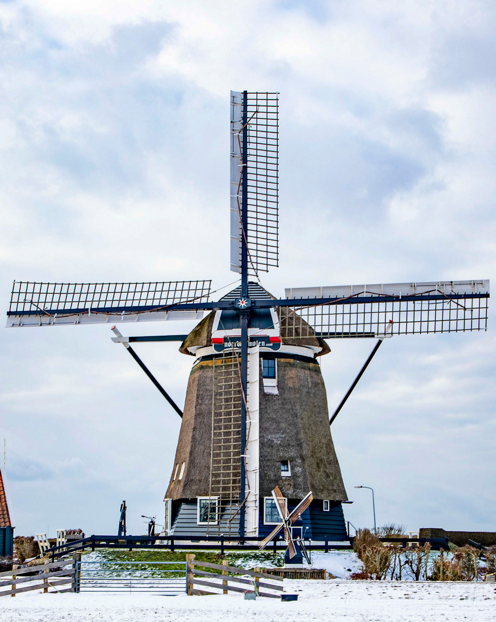
Als ik denk aan de burgemeester van Castricum, dan zie ik iemand die... "verbindend maar ook doortastend is."